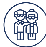
Одлазак у пензију